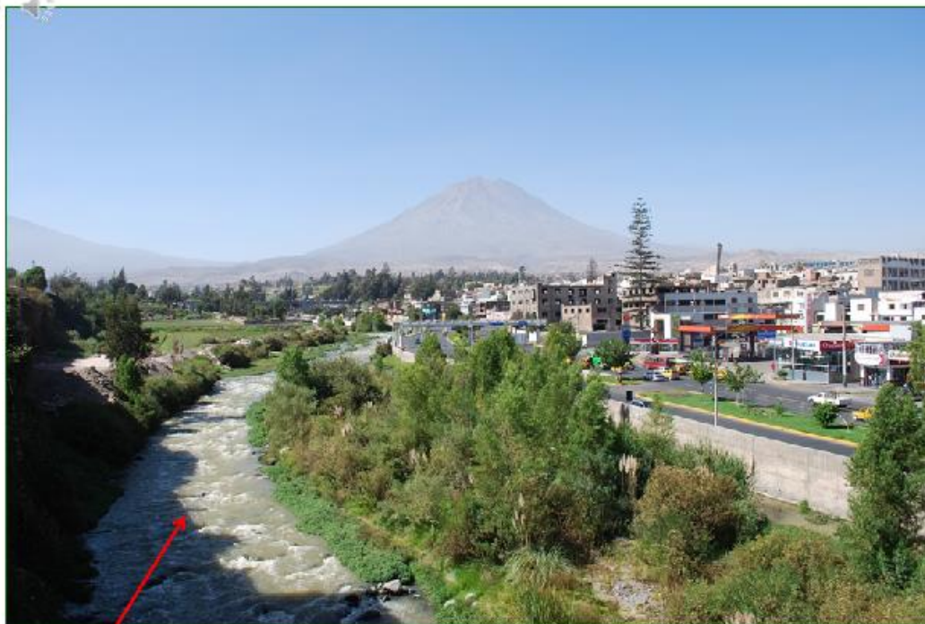
La rivière qui traverse la ville s'appelle Rio Chili.