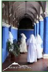
Voici le Couvent de Santa Catalina.