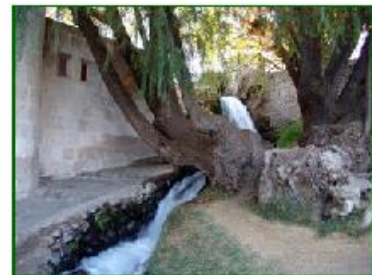
Voici le Moulin de Sabandía.