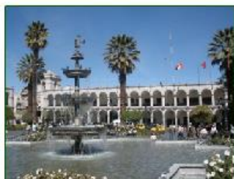
La place principale s'appelle Plaza de Armas.